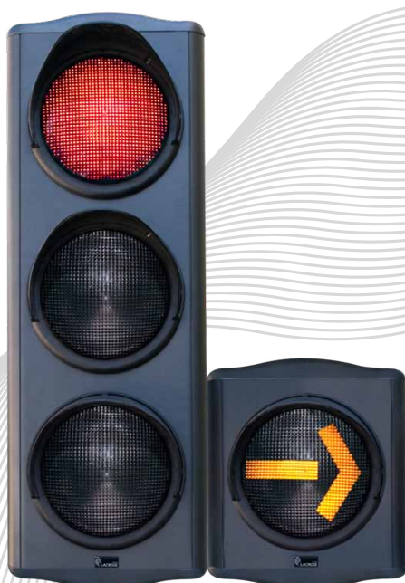
Tricolore 3x200mm + anticipation