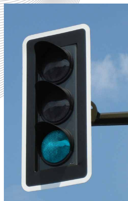
Tricolore 3x300mm avec écran de contraste sur potence